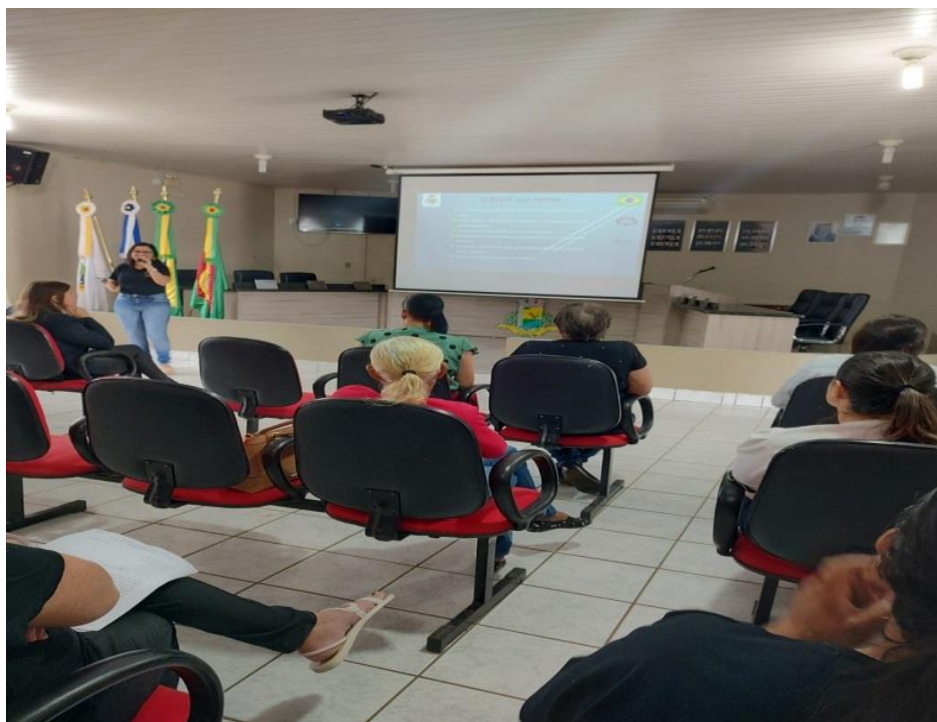
Foto 4-Grupo Debate