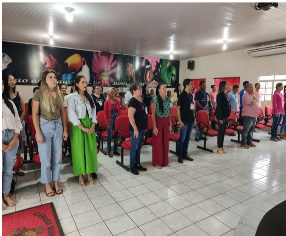
Foto 2- Cerimonial De Abertura/Autoridades