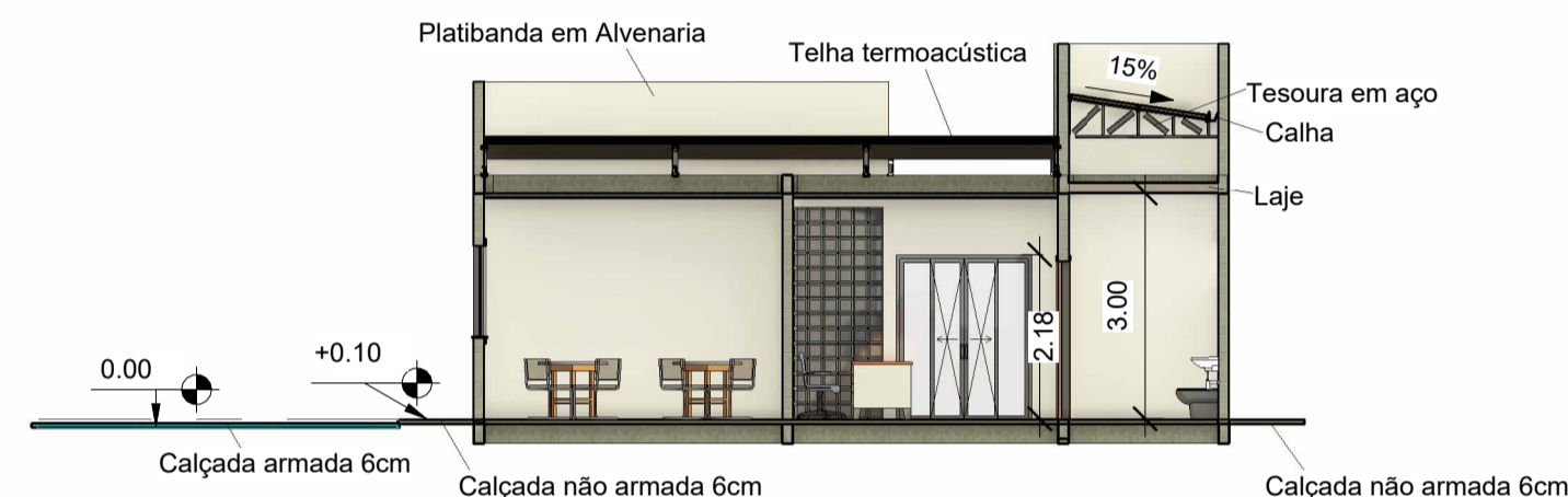
4 Corte BB 1 : 100