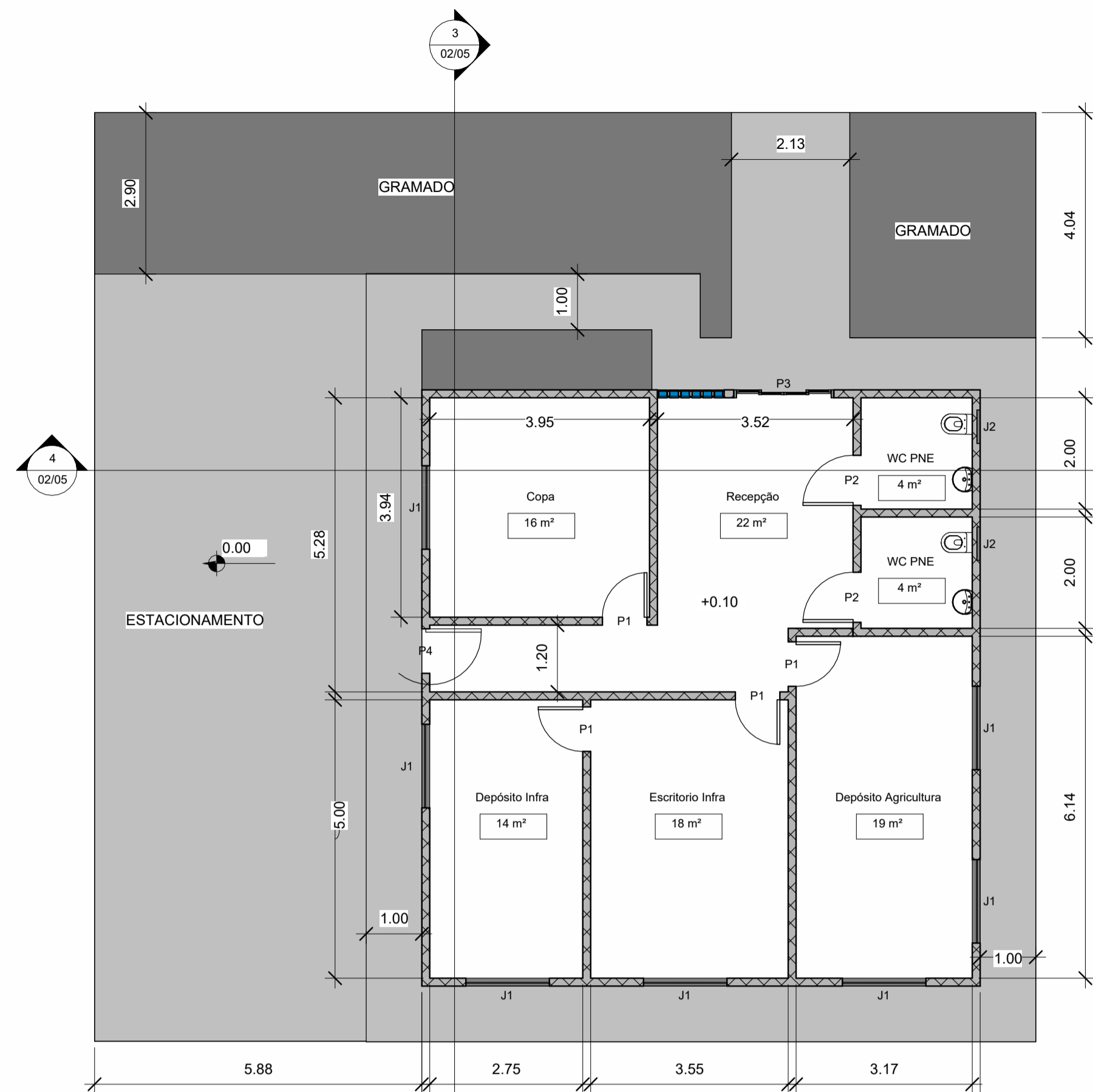
1 Planta Baixa 1 : 75