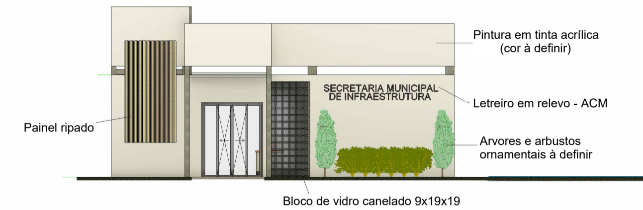
5 Fachada 1 : 100