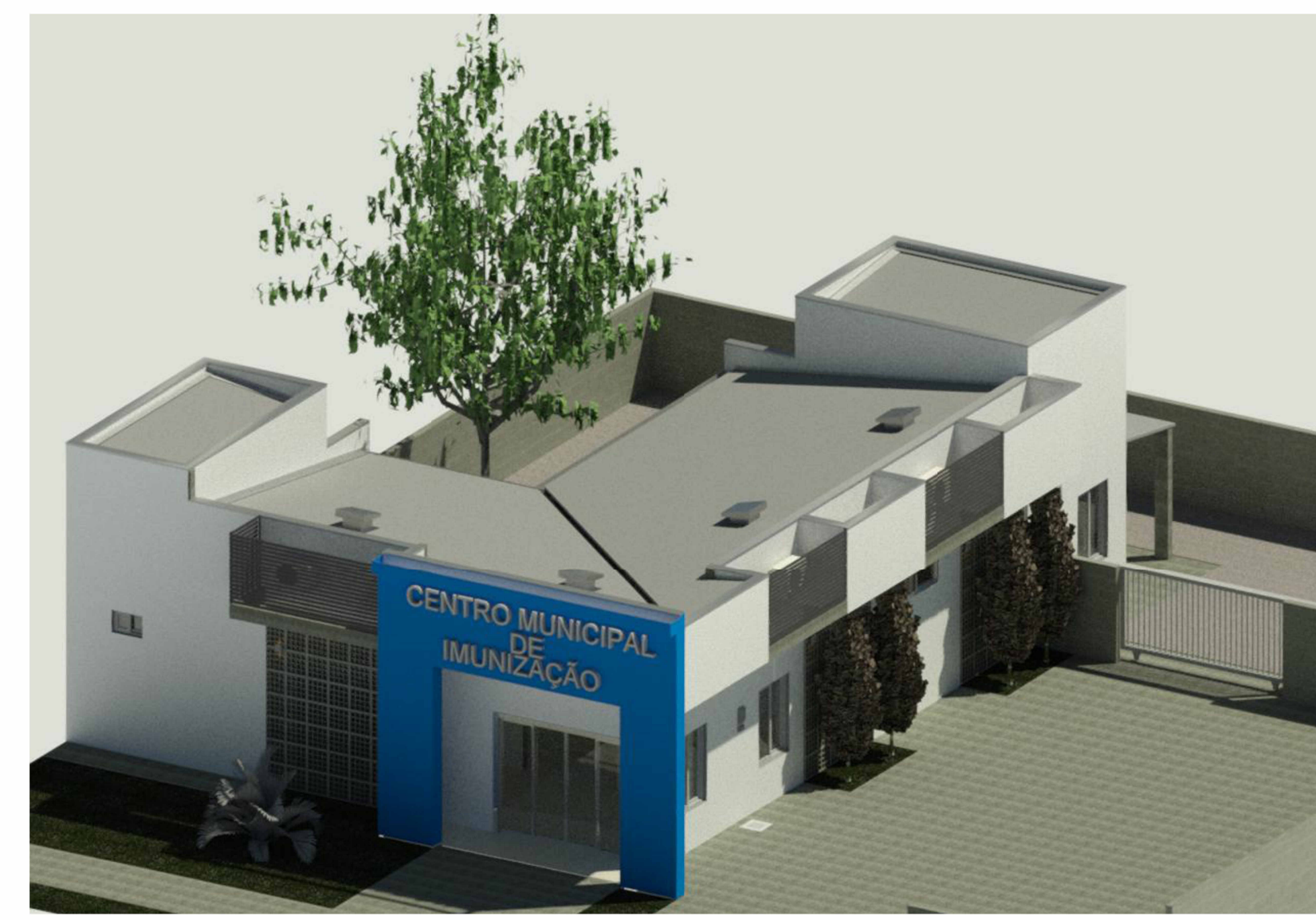
4 VISTA 3D 1 : 1